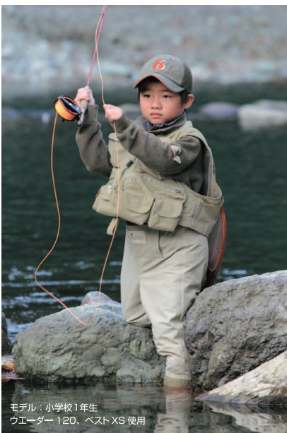
モデル：小学校1年生 ウエーダー 120、ベスト XS 使用